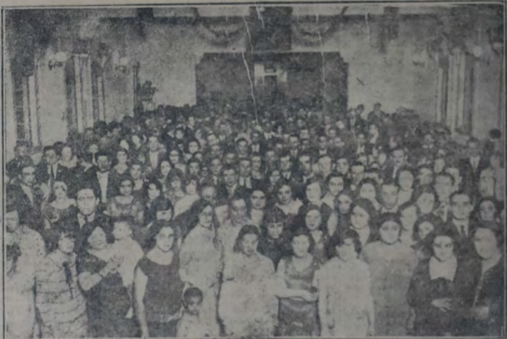
Parte de la concurrencia al baile de anteanoche

También para los Trajes sobre Medida hemos establecido 3 únicos precios o sea $ 78.- 99.50 y 115.- anulando todos los demás desde pesos 85 hasta 170.