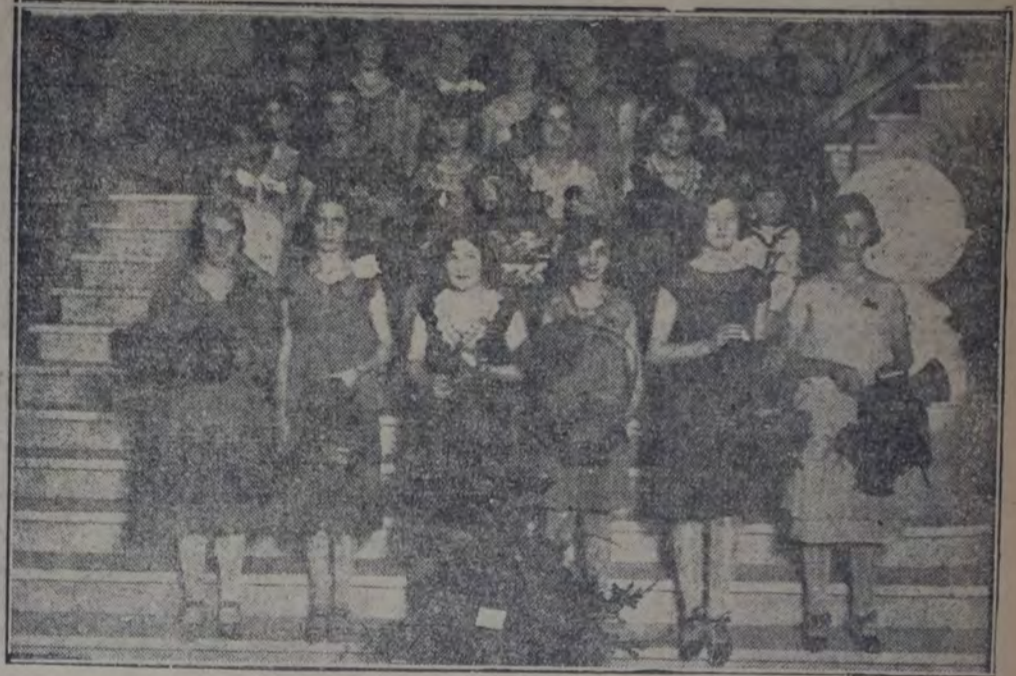
Comisión de señoritas que tuvo a su cargo la venta de flores y pantallas

Con el acto infantil llevado a efecto en la tarde de ayer, se ha dado cumplimiento íntegramente al programa de festejos preparado por la secretaría general de nuestro Partido celebrando la inauguración de la Casa del Pueblo.